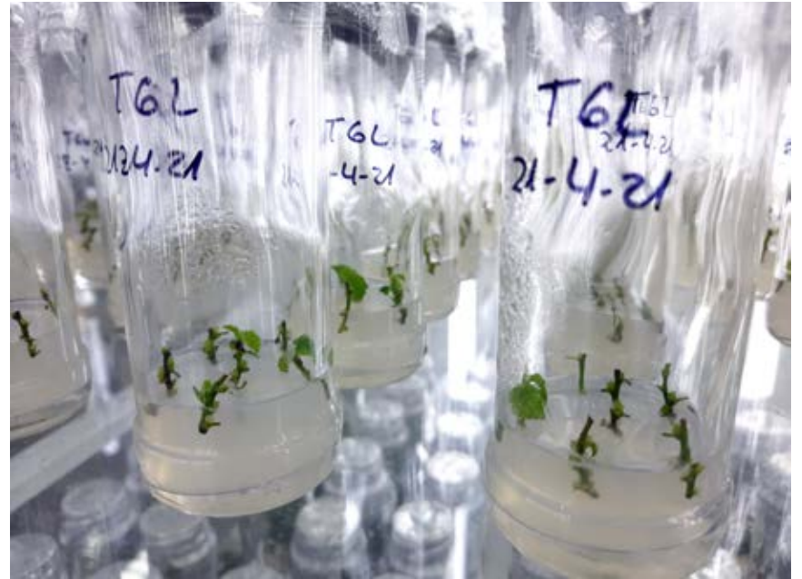
Variedad Tonda Gentile delle Langhe en proceso de multiplicación in vitro.

sin lugar a dudas el principal pilar para modernizar este frutal de nuez y con ello anticipar la entrada en producción y aumentar los rendimientos unitarios. No obstante, para zonas con menos recursos hídricos será necesario implementar modelos productivos con portainjertos más vigorosos que permitan explorar el suelo a mayor profundidad. Es una línea de trabajo que se está comenzando a desarrollar. Adicionalmente, esperamos bajar la incidencia del