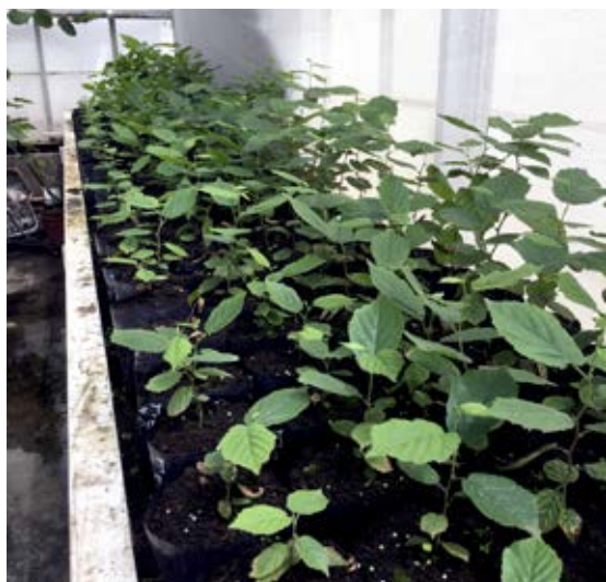
Desarrollo y crecimiento de variedades bajo condiciones controladas.