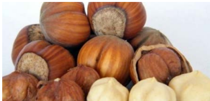
Frutos de la variedad Tonda di Giffoni: cáscara delgada, buen pelado al tostado, buen aroma, principal variedad plantada en Chile para la industria, con buena adaptabilidad desde la zona centro sur-sur del país.

Hoy en día, la zona que concentra la mayor parte de las plantaciones de avellano europeo es la región del Maule, donde prevalece la variedad Tonda di Giffoni. Además, hay huertos comerciales en Bío Bío, La Araucanía, Los Ríos y los Lagos.