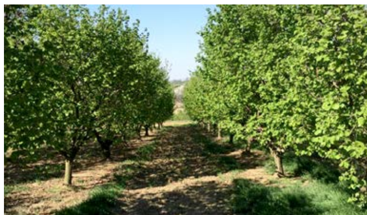
Huerto de una selección de la variedad Tonda delle Langhe, región Piemonte, comuna de Lu, Italia. Material introducido in vitro.

Pautet y San Giovanni, de España: estas dos últimas principalmente como polinizadores). “Estos dos polinizadores los utilizaremos para las variedades Tonda Gentile delle Langhe y Tonda di Giffoni, respectivamente. Se caracterizan por su compatibilidad genética, muy importante porque el avellano europeo es una especie monoica, es decir, en el mismo árbol tiene flores masculinas y femeninas pero que no son compatibles: la especie presenta autoesterilidad. La autoesterilidad hace estrictamente necesaria la asociación con variedades polinizadoras para lograr rendimientos satisfactorios. Por ello, se deben establecer en el mismo huerto diversas variedades genéticamente compatibles con la variedad principal y que florezcan de manera simultánea”, justifica.