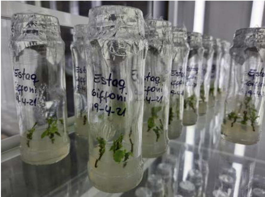
Estaquillas de Tonda di Giffoni en fase de multiplicación in vitro en medio de cultivo sólido.