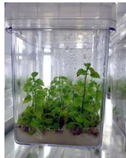
Multiplicación in vitro.