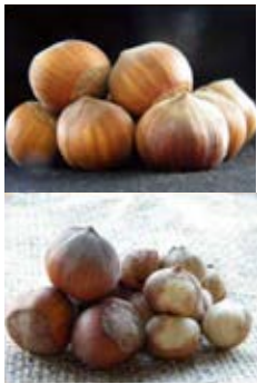
Frutos de la variedad Tonda Romana: forma globular, cáscara delgada, rendimiento al descascarado (45%), variedad apreciada por la industria de transformación, interesante para asociar en huertos con Tonda di Giffoni, se poliniza con Tonda di Giffoni.