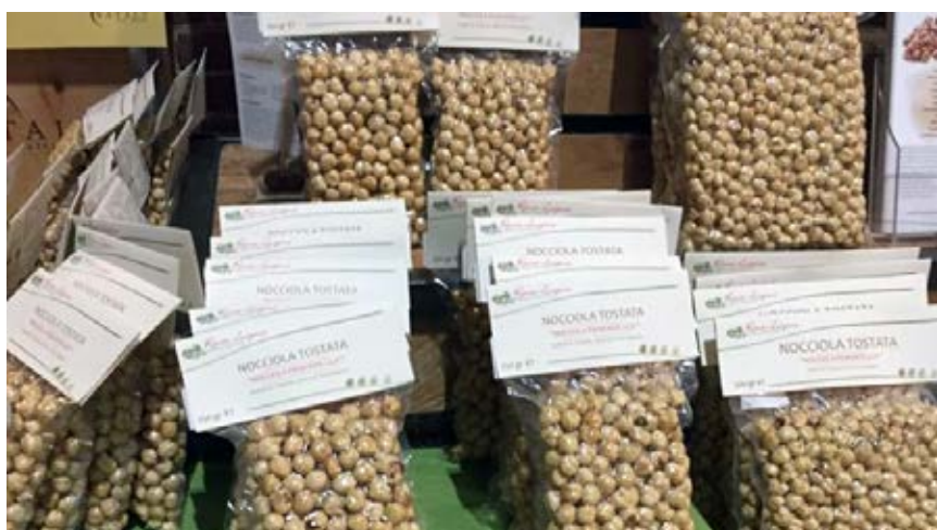
Frutos de Tonda Gentile delle Langhe, mejor variedad industrial a nivel mundial, según la industria de transformación. Se destaca por su excelente sabor y aroma luego del tostado. Buen pelado del perisperma, y rendimiento industrial aceptable (45,6%), cáscara delgada.

Hasta el momento se han introducidos tres variedades in vitro (una selección de Tonda Gentile delle Langhe, desde región de Piemonte, Italia; y las variedades