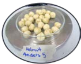
Frutos de avellanas de la selección clonal Anders 5, con excelente calidad industrial (> 52% de rendimiento al descascarado, fruta redonda y buen pelado del perisperma después del proceso de tostado).